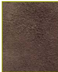
Bio-camuça de cor castanha

Está autorizada a utilizar o rótulo Biocalce Básico, em peles de corte para uso em calçado forrado de acordo com as especificações expressas no boletim de ensaios: CQ-1715/2008 de 2008/12/04 para o seguinte artigo: